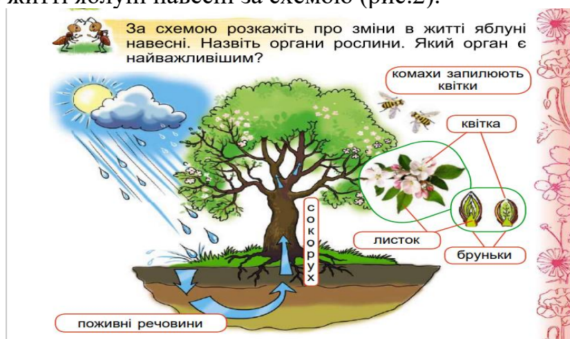
Рис.2. Схема розвитку яблуні навесні [2, с. 57]

На наступному етапі доцільно розказати учням про першоцвіти, які занесені до Червоної книги. Завершальним завданням є розповідь учнів про зміни в житті яблуні навесні за схемою (рис.2).