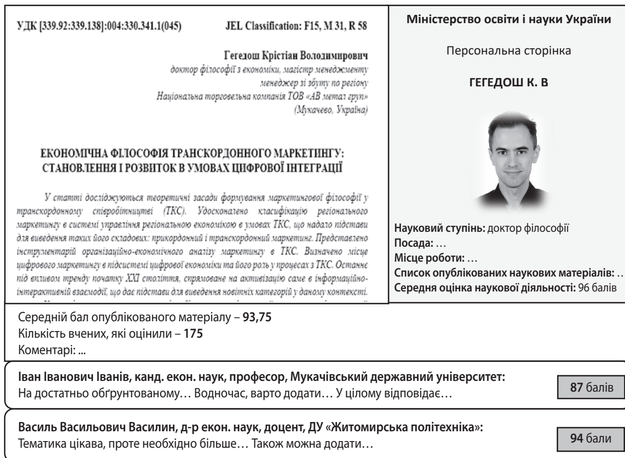
Рис. 2. Оцінна WEB-платформа наукової діяльності вченого в умовах формування цифрового суспільства

Сьогодні Україна поетапно переходить із класичної в новітню модель освітньої та наукової системи розвитку людських ресурсів. «Праця» є надзвичайно важливим фактором виробництва, який у деяких країнах виводить їх на світову арену конкурентоспроможних виробництв. Загальновідомим прикладом служить Японія, яка, не маючи природних багатств (а саме, «землі») як одного з важливих фак-