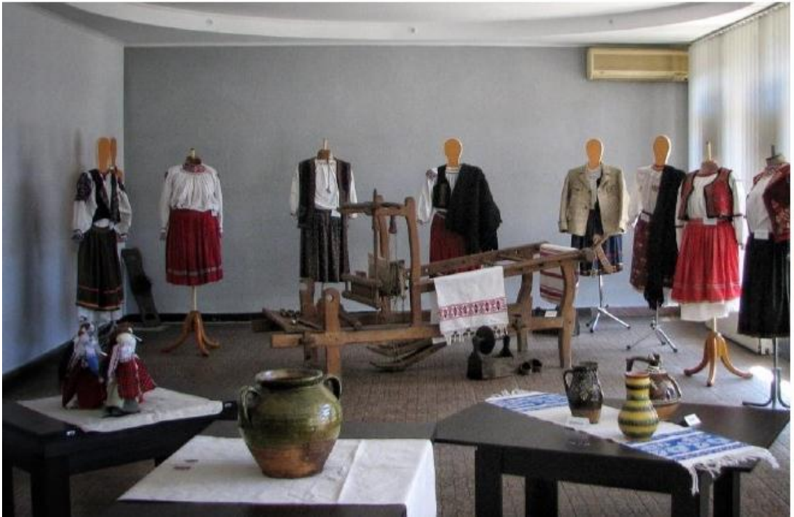
Рис. 2 - Музей прикладного мистецтва Закарпаття Мукачівського державного університету

Тут часто проводяться тематичні майстер-класи, уроки краєзнавства (рисунок 2) [4].