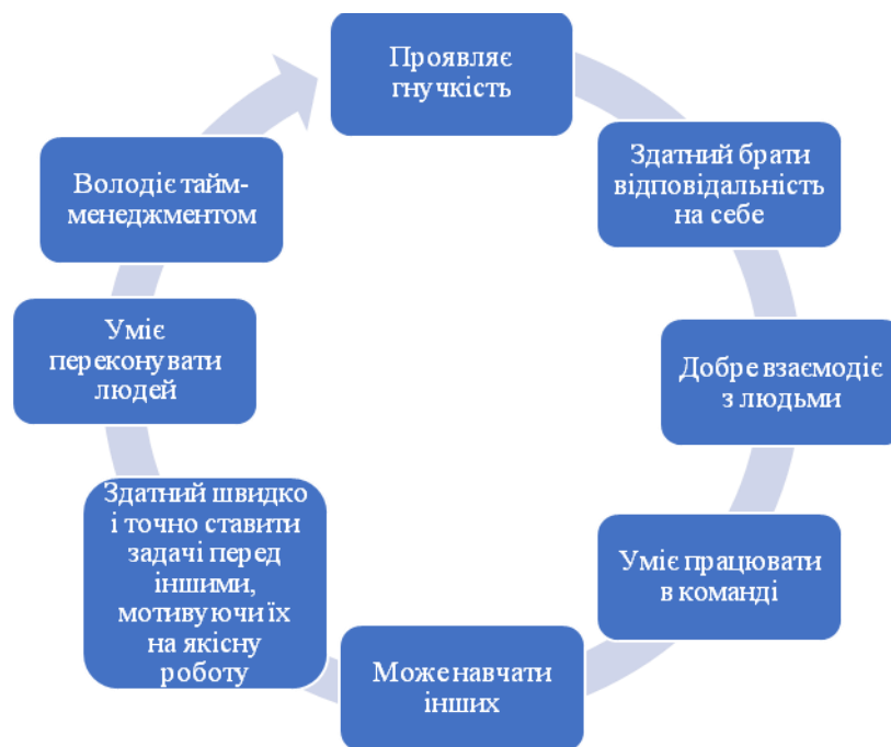
Рис. 1. Характеристики працівника, який має сформовані навички soft skills (за Ю. Портландом)

Сучасна вища педагогічна освіта потребує реформ, що спрямовані на розвиток навичок, які є популярними на ринку праці. Ці реформи вимагають інноваційних перетворень в усіх компонентах освітньої системи, включаючи безперервну освіту, онлайн-навчання та змішане навчання.