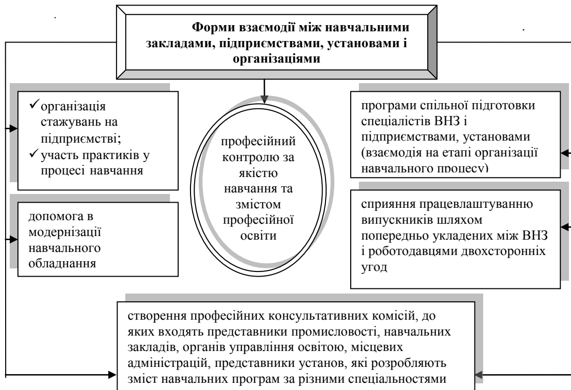
Рис.1. Форми взаємодії між вузами і представниками різних сфер діяльності

Аналізуючи основними рисами європейської моделі взаємодії освіти і ринку праці та можна констатувати що формування єдиного механізму забезпечення співпраці між даними сферами на засадах соціального партнерства забезпечуються активним сприяння держави, що закріплені на законодавчому рівні, входять в обов'язки окремих інституцій, мають належне фінансування з різних джерел, несуть спільну відповідальність за формування майбутнього європейського співтовариства[4].