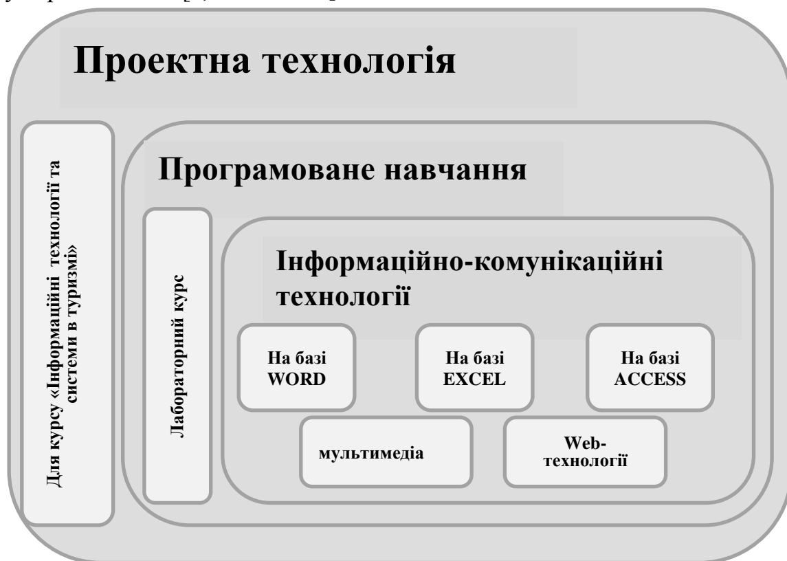
Рис.1.1. Зв'язок технології навчання з засобами інформаційно-комунікаційних технологій

Проектна технологія передбачає використання різноманітних методів, засобів навчання та інтегрування знань, умінь з різних галузей науки. Суть проектної технології полягає в стимулюванні інтересу студентів до певних проблем та процесу їх розв'язання. [3, с.158 – 162].