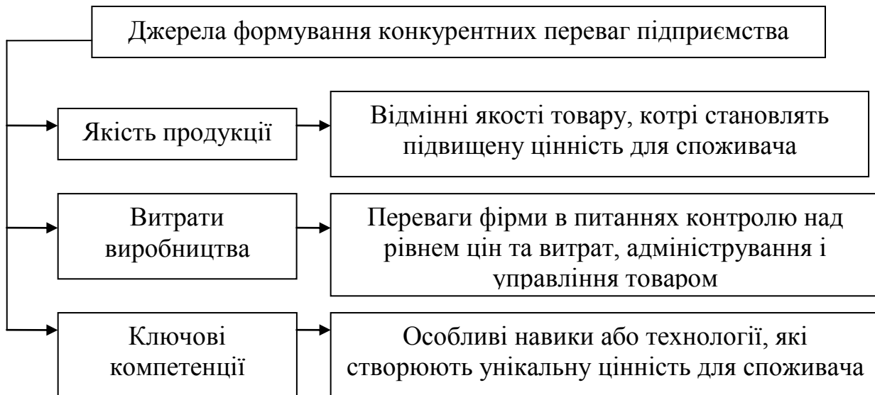
Рис. 1.2 Джерела формування конкурентних переваг за Ж. Ламбенем [2, с. 18]