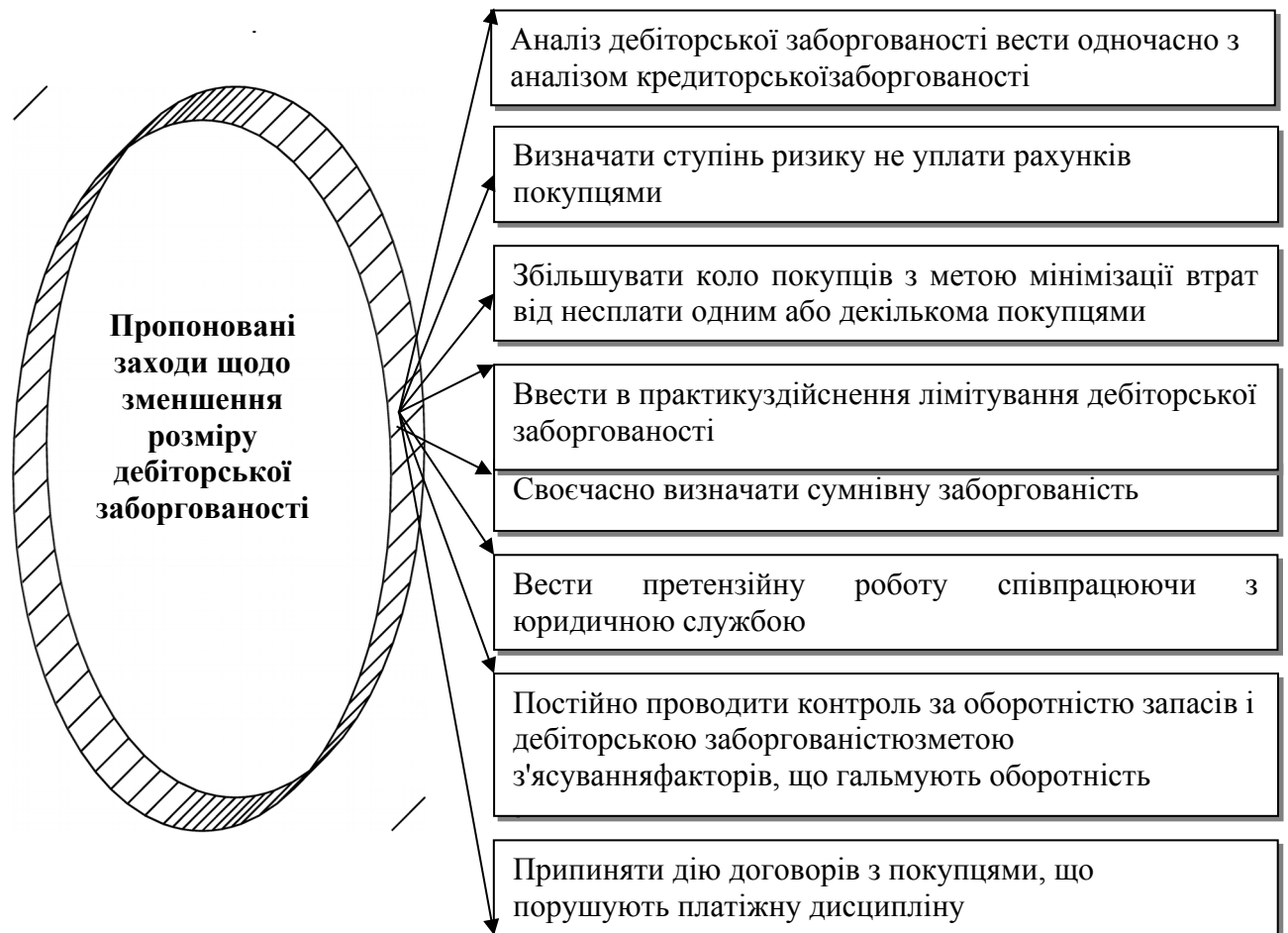
Рис. 3. Заходи щодо зменшення розміру дебіторської заборгованості на підприємстві

Підсумовуючи наше дослідження можна зробити висновок, що з метою отримання повної й оперативної інформації щодо різних видів дебіторської заборгованості, яка складає значну частку у структурі оборотних коштів, доцільно забезпечити організацію цієї ділянки роботи з використанням розроблених нами класифікаційних ознак дебіторської заборгованості, що дасть можливість оперативно і якісно управляти процесом виникнення та погашення дебіторської заборгованості.