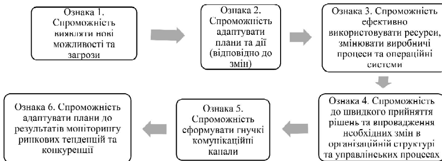
Рис. 1. Ознаки реактивності в контексті стратегії диверсифікації готельних та ресторанных мереж