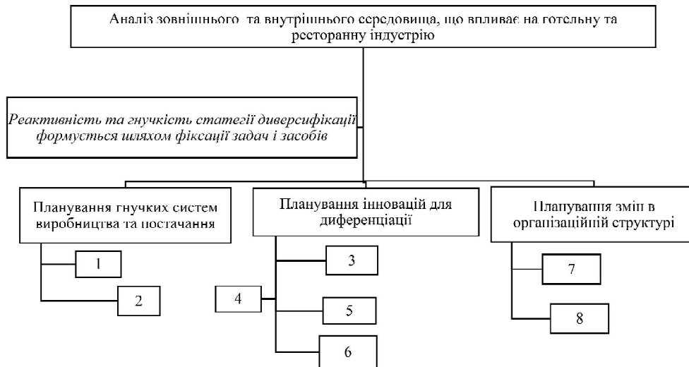
Рис. 3. Ключові аспекти формування реактивної та гнучкої стратегії диверсифікації готельних та ресторанних мереж