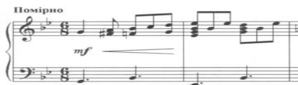
Рис.1. Зразок відтворення музичного матеріалу mf

Вступ (1 – 8 такти). Партія фортепіано нескладна технічно, проте вимагає дотримання чіткого метроритму 6/8, що сприяє передаванню вальсовості характеру. Виконавцеві потрібно звернути увагу на ведення малих тематичних мелодійних обертів ( legato ) та манери супроводу moderatamente (помірно) на першій сильній долі, на другій щодо першої долі. Виконання певної частини музичного твору ( mezzo-forte ) у високому регістрі та чуттям єдиної музичної фактури твору за поступового зростання й агогічного розвитку є складним (див. рис. 1.1) [7].