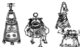
Рис.2. Сумки XVI – XVIII століть