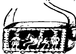
Рис.3. Сумка для коновала

Шкіряні сумки у сільського населення зустрічалися дуже рідко і були ознакою якоїсь професії. Так шкіряні сумки із грубої юхти носили пастухи[3]. Це були сумки півкруглої форми з нешироким відформованим ботаном або плоскі. Клапан закривав усю передню стінку, а щоб він не хлопав на ходу до нього пришивали куски товстого ремня, який виступав за край сумки. Клапан оздоблювали різними бляшками або декоративними цвяхами. Таку сумку носили через плече. Особливу сумку мали коновали: невелика, із жорсткої шкіри, прямокутної форми і простими клинчиками (рис.3).