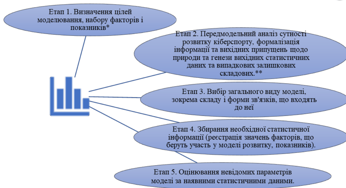
Рис. 1 - Етапи реалізації методики кореляційно-регресійного аналізу розвитку кіберспорту на основі рівнянь парної лінійної регресії