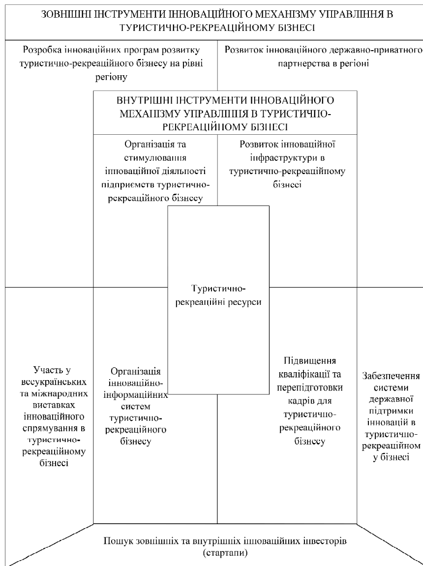
Рис. 1. Інноваційний механізм управління в туристично-рекреаційному бізнесі