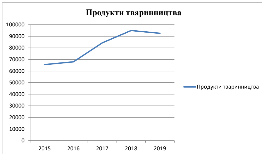
Рис. 3. Продукти тваринництва