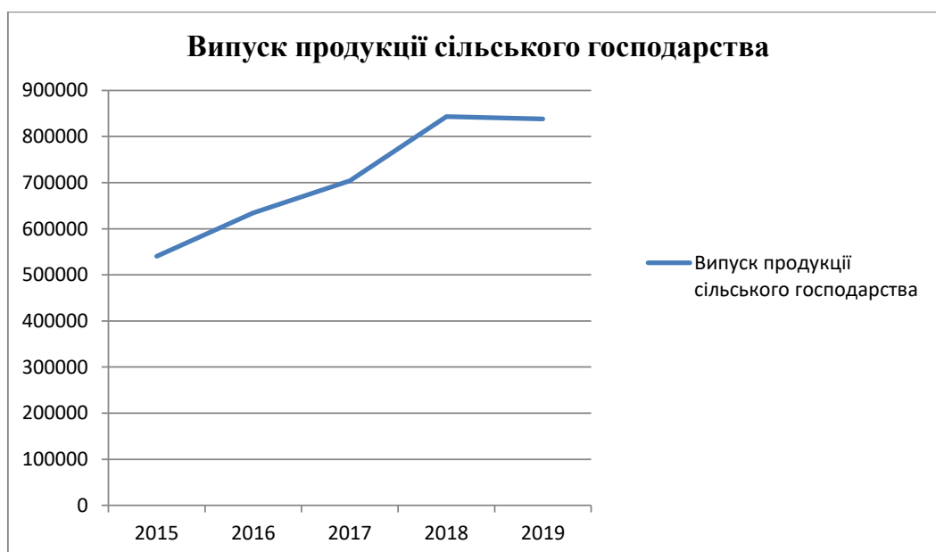
Рис. 4. Випуск сільського господарства