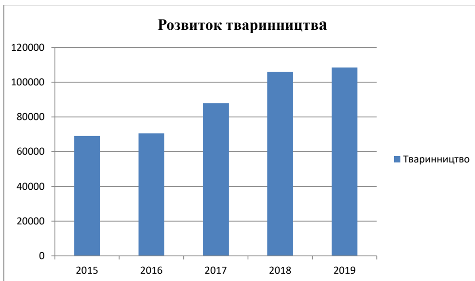
Рис. 2. Розвиток тваринництва