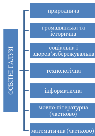
Рис 3. Освітні галузі інтегрованого курсу «Я досліджую світ»

Навчальний предмет «Я досліджую світ» є інтегрованим і складається з модулів природничо-наукової та соціально-гуманітарної спрямованості, а також передбачає вивчення основ безпеки життєдіяльності. Для реалізації принципів НУШ, зокрема інтегрованого і компетентнісного навчання, у типових освітніх програмах для початкової школи запроваджено й інтегрований курс «Я досліджую світ». Курс інтегрує такі освітні галузі: