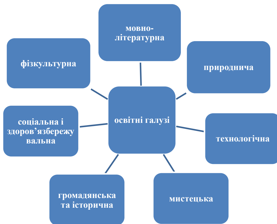
Рис.1. Освітні галузі

Вимоги до обов'язкових результатів навчання та компетентностей здобувачів освіти визначено за такими освітніми галузями: