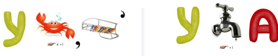
Рис 5. Ребус

Своєрідною формою загадування загадок є ребус. У ребусі відгадуване слово подається у вигляді малюнків у поєднанні з буквами та іншими знаками.