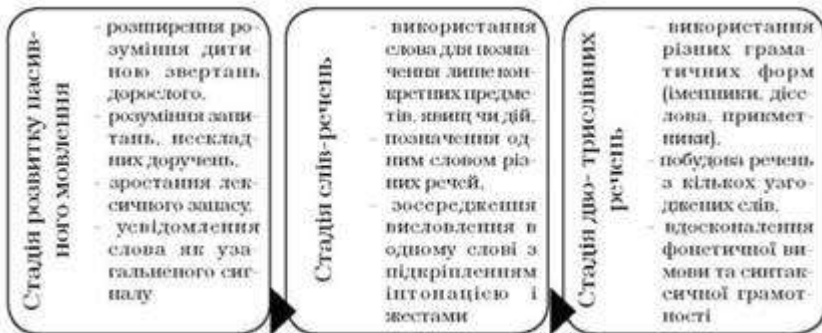
Рис. 7. Стадії розвитку мовлення переддошкільника

Ранній період - це стадія сенситивності дитини до розвитку мовлення. На початку періоду, коли відбувається оволодіння ходою і предметними діями, темп розвитку активного мовлення дещо повільніший, хоча інтенсивно розвивається пасивне мовлення. Після двох років вивчення предметів, збагачення вражень викликає у малюка потребу їх висловити, запитати щось у дорослого, тому прискорюється розвиток активного мовлення. Впродовж раннього віку спостерігається його наступна динаміка: