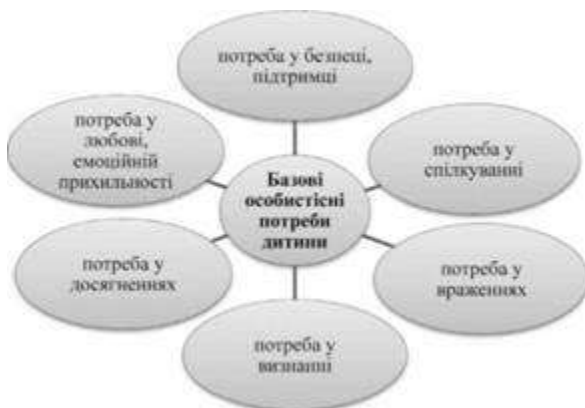
Рис.8. Базові особистісні потреби переддошкільника за Реаном Дослідниця кризи 3-ох років Ельза Келер виділила 7 її типових характеристик:

Особистісний розвиток дитини цього віку відбувається на основі тієї системи мотивації, яка склалася відповідно до соціальної ситуації розвитку. За свідченням А.О. Реана, систему мотивації дитини визначають провідні особистісні потреби: