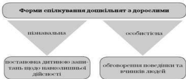
Рис. 9. Форми спілкування дошкільнят з дорослими