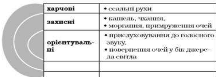
Рис. 4. Базові безумовні рефлекси новонародженого

Фаза новонародженості охоплює перші 4-6 тижнів