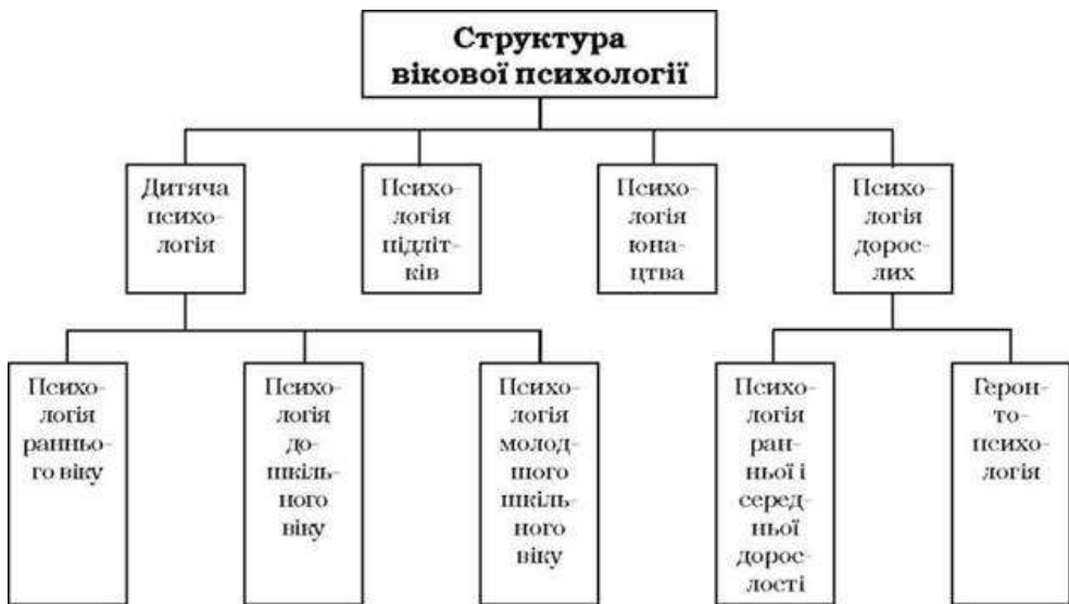
Рис. 1 Структура вікової психології

Опорна схема представлена на рисунку 1 допоможе закріпити знання студентів про структуру вікової психології.