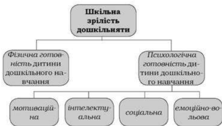
Рис. 12. Шкільна зрілість та її компоненти

Шкільна зрілість є інтегральною характеристикою дитини і складається з фізичного та психологічного компонентів.