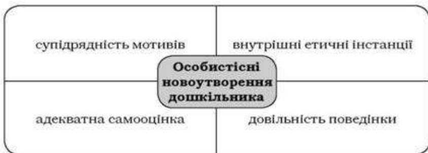
Рис. 11. Особистісні новоутворення дошкільнього віку

Дошкільний вік є важливим етапом формування особистості, результатом якого є поява в кінці періоду ряду особистісних новоутворень.