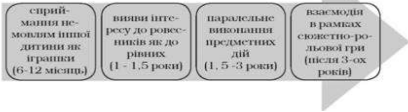
Рис. 6. Динаміка спілкування дитини з ровесниками (перший-третій роки життя)

Предметно-маніпулятивна діяльність - система дослідницьких дій, маніпуляцій дитини з предметами, спрямована на вивчення їх функціонального призначення