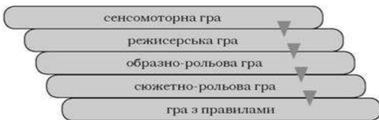
Рис. 10. Динаміка гри в дошкільньому віці

Дошкільний вік є важливим етапом формування особистості, результатом якого є поява в кінці періоду ряду особистісних новоутворень.