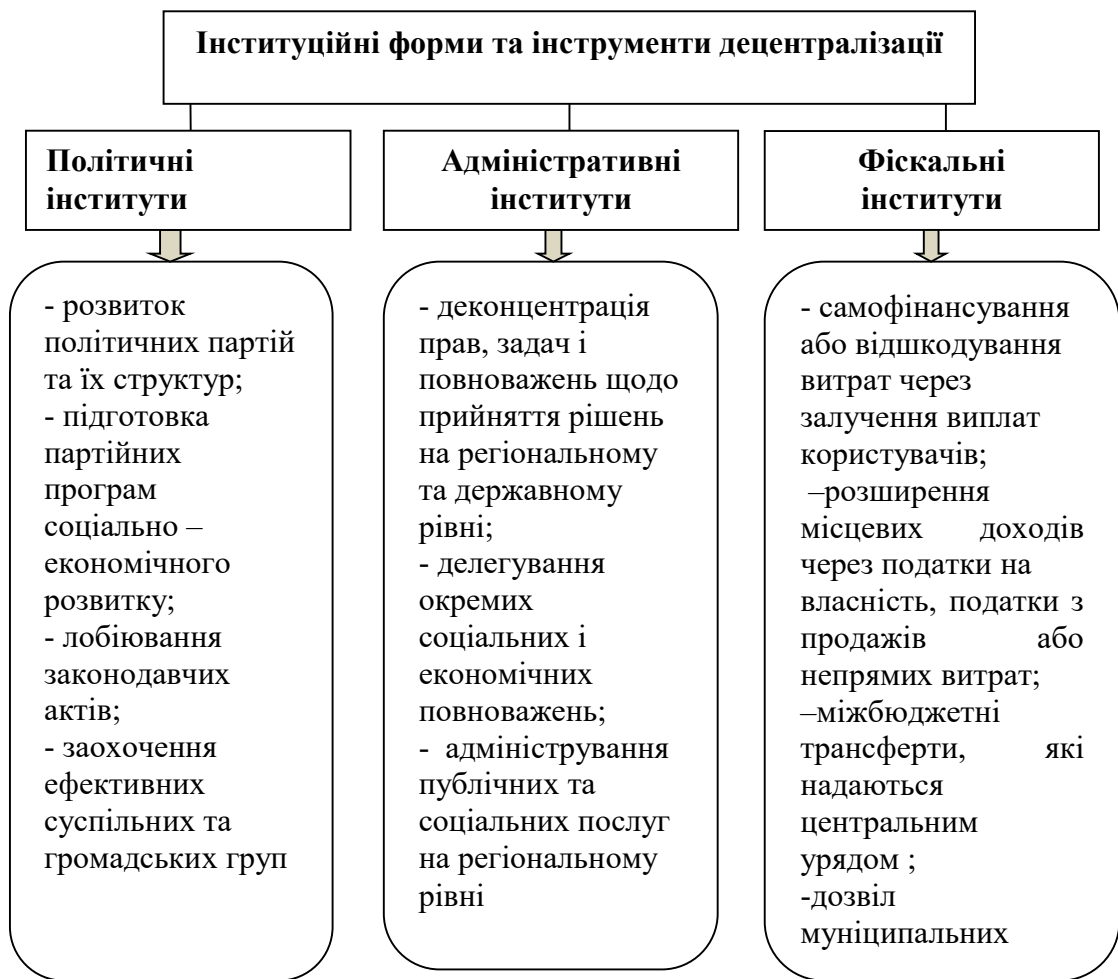
Рис. 2. Форми та інструменти децентралізації

Побудова дієвого інституційного забезпечення соціально-економічного розвитку у контексті процесів децентралізації повинна базуватися на гармонійному поєднанні таких складових (рис. 2.), функціонування яких в Україні на поточному етапі знаходиться на стадії поступового впровадження.