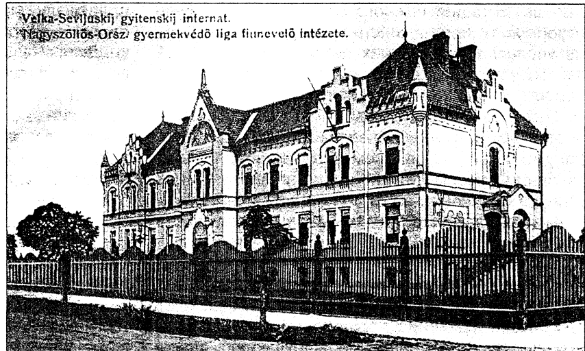
Velka-Sevjujskij gyitenszki internat. Nagyszöllös-Ország gyermekvédelő liga fiúnevelő intézete.

Особливу увагу держава приділяла захисту покинутих/занедбаних дітей та дітей-сиріт, для яких було створено заклади, що забезпечували їх повне державне утримання, повноцінний розвиток та виховання на всіх етапах вікового розвитку. Звідси постала необхідність удосконалення нормативно-правової бази щодо створення та розвитку закладів інтернатного типу, для чого було прийнято два важливі закони – Закон VIII «Про державні дитячі притулки» (1901 р.) [6] та Закон XXI «Про дітей, які досягли 7-річного віку та потребують державної допомоги» (1901 р.) [7]. Закон VIII стосувався дітей, яких офіційно визнано покинутими, і яким не виповнилося 7 років. У §1 зазначається, що для цієї категорії дітей необхідно відкрити державні центри по догляду за дитиною (дитячі притулки) як у м. Будапешт, так і в інших регіонах країни. Зокрема, «державні дитячі заклади в інших містах держави,