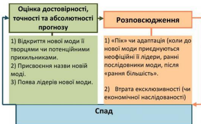
Рис. 1. Основні стадії модного циклу, встановлені дослідниками моди

Мета та завдання дослідження. Метою дослідження є розробка наукових принципів проектування сучасного одягу на основі прогнозування моди. При цьому основним завданням є використання механізмів циклічного підходу як наукових методів пізнання, які сприяють інноватиці рішень сучасного одягу.