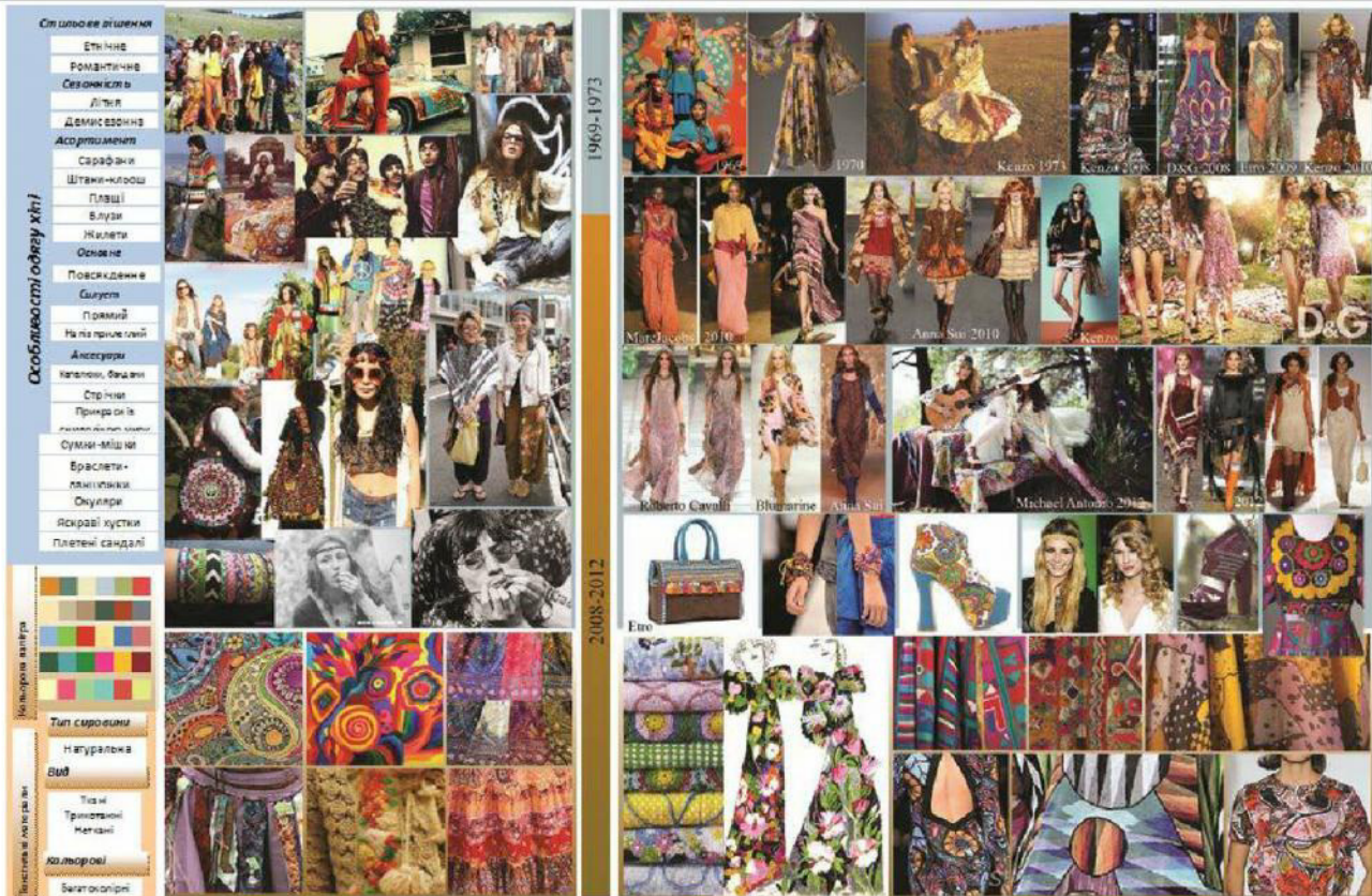
Рис. 5. Візуалізація взаємозв'язків стильових особливостей одягу та текстильних матеріалів субкультури хіпі з періодами найбільшого розвитку моди