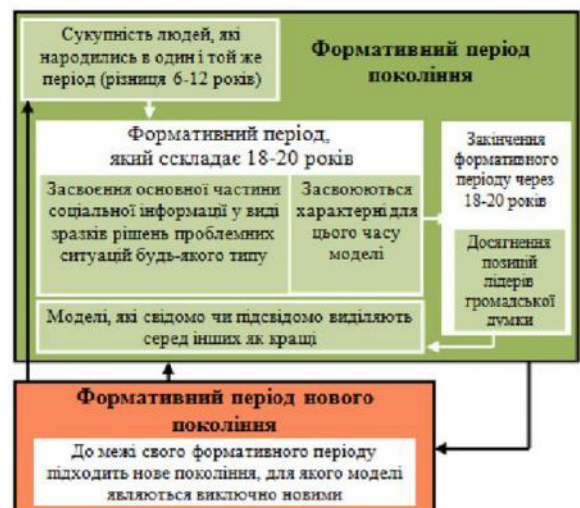
Рис. 3. Систематизація періодів циклічності моди за Л.І. Ятіною