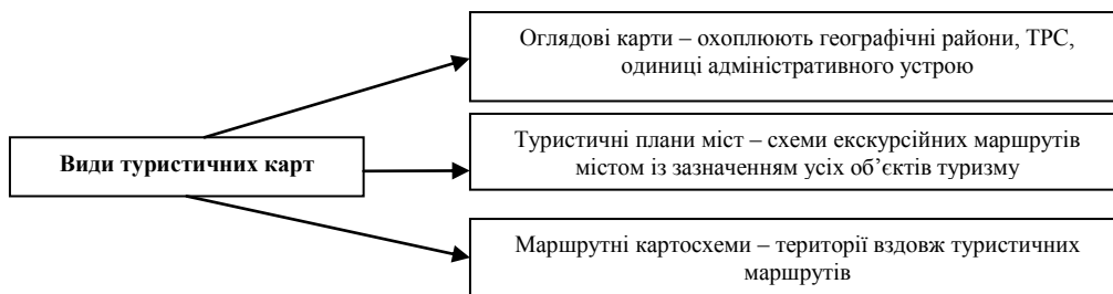
Рис. 1. Класифікація туристичних карт

Існують різноманітні класифікації туристичних карт. Але загалом всі вони зводяться до класифікації, відображеної на рис. 1.