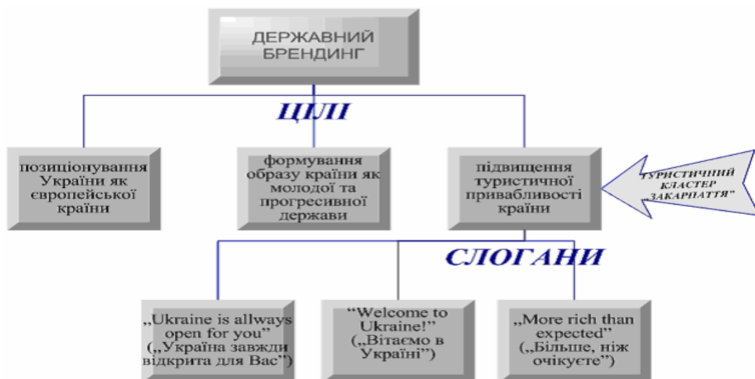
Рис.2. Цілі державного брендингу України та їх туристичний аспект

На нашу думку, з метою створення та поширення ефективного бренду країни необхідно витратити 10-15 років на цілеспрямовану та скоординовану діяльність у зазначеному напрямку.