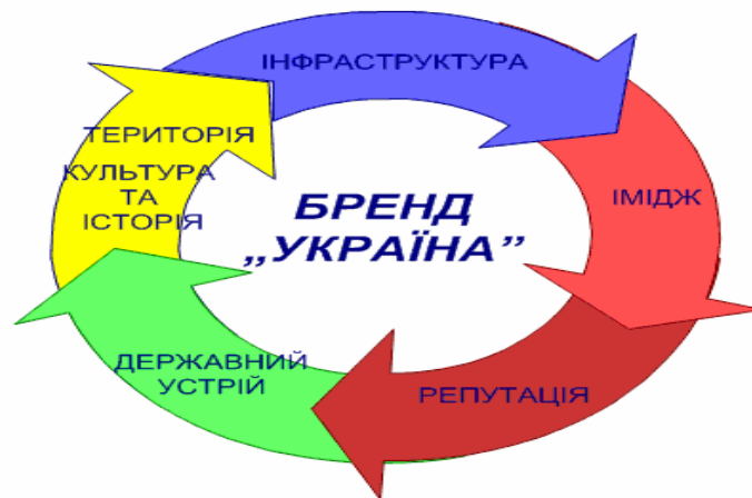
Рис.1. Характеристики національного бренду

На рис. 1 представлено взаємозв'язок характеристик бренду «Україна», що стосується також і турклястеру «Закарпаття».