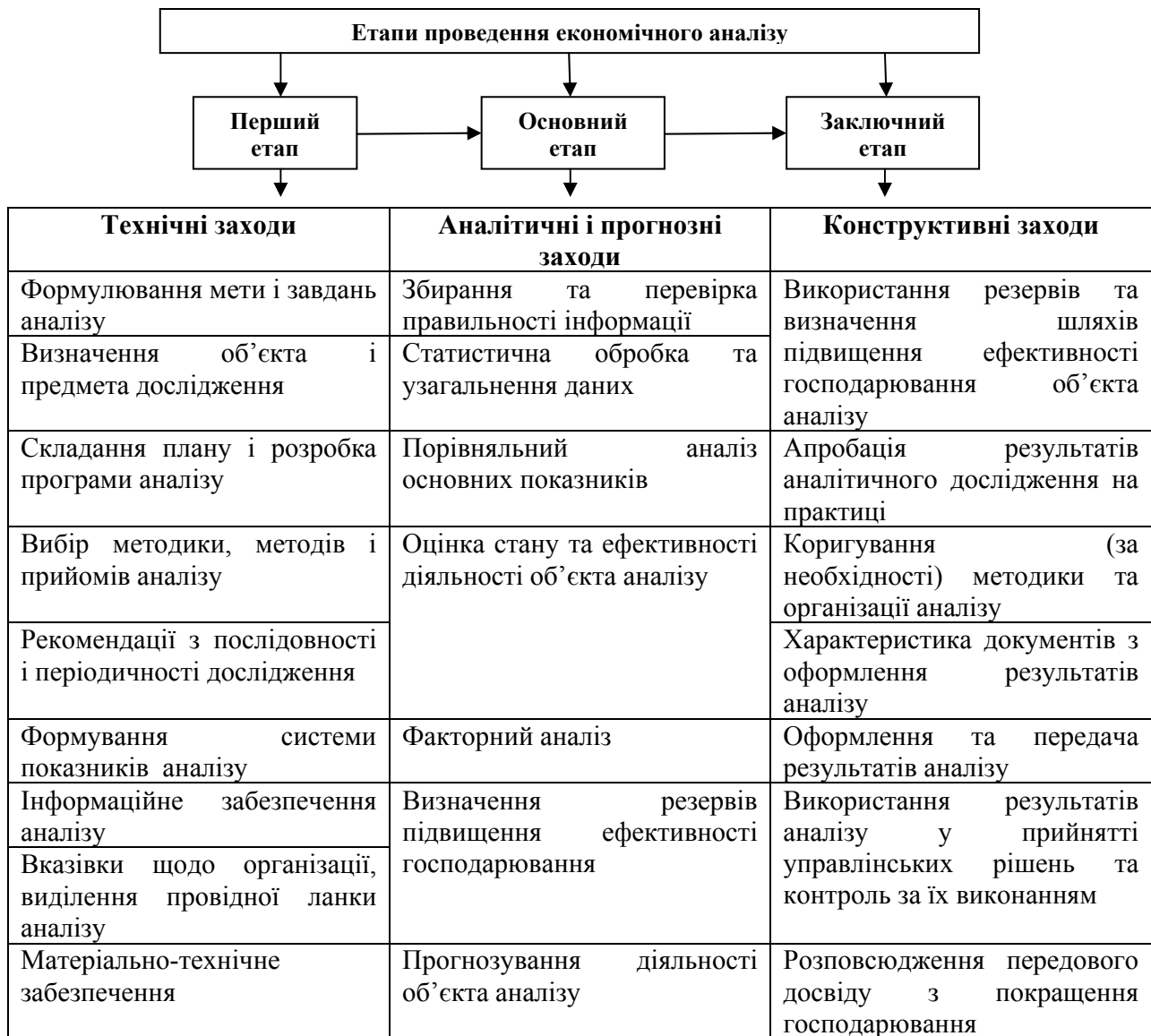
Рис.3. Етапи проведення економічного аналізу

Економічний аналіз як комплексний і системний процес включає три послідовні організаційні етапи: підготовчий, виконавчий і заключний. Кожен з цих етапів у свою чергу поділяється на складові. У кінцевому підсумку це становить організаційну структуру економічного аналізу на підприємстві (рис.3).