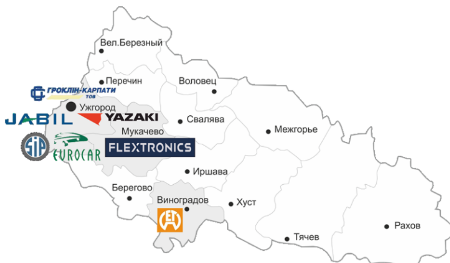
Рис. 2. Підприємницька інтерактивна карта Закарпаття у структурі української сторони Карпатського Єврорегіону