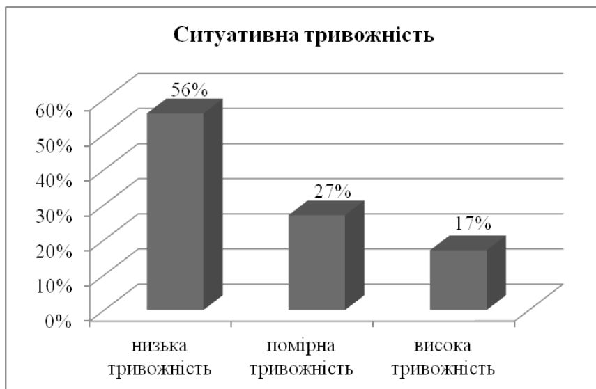
Рис. 3 Значення ситуативної тривожності за методикою Спілберга і Ханіна

Отже, не зважаючи на те, що соціальна мережа стає інструментом компенсаторного процесу, яка надає можливість створити максимально комфортне і знайоме середовище для підлітка, в якому він може вибудувати комунікації, для підлітків, які вже мають високий поріг тривожності, соціальну взаємодію в рамках Інтернет – спілкування надає більшою мірою негативний вплив на ведення комунікаційної діяльності в реальному житті.