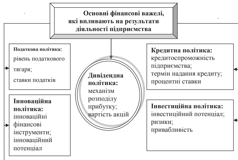
Рис. 1. Фінансові важелі, які впливають на результати діяльності підприємства

Необхідно констатувати, що стан підприємства, його економічні показники залежать як від зовнішніх, так і внутрішніх факторів. До зовнішніх факторів