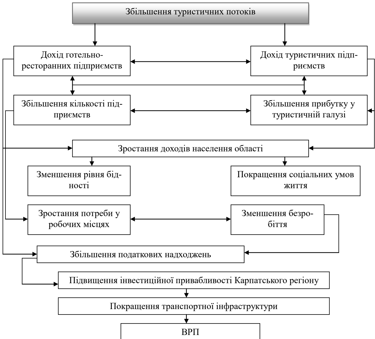
Рис. 2. Модель впливу туризму на соціально-економічний розвиток Карпатського регіону (власна розробка автора)

рмується на основі таких елементів, як збільшення туристичних потоків, збільшення доходів готельно-ресторанних підприємств та туристичних підприємств, зростання доходів населення, зменшення рівня бідності та покращення соціальних умов життя, зростання потреби у робочій силі та зменшення безробіття, що у свою чергу призведе до збільшення податкових надходжень, підвищення інвестиційної привабливості області, покращення транспортної інфраструктури та зростання ВРП (див рис. 2).