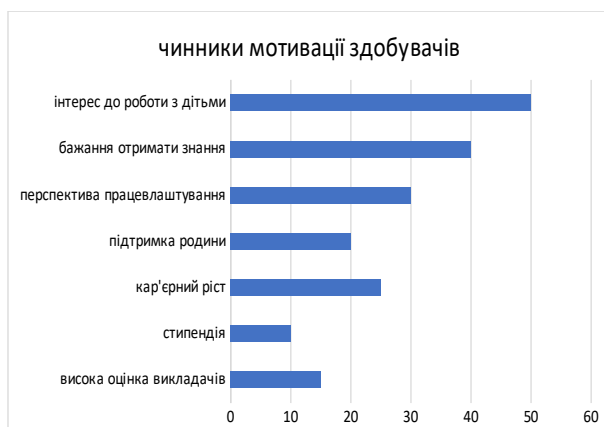
Рис. 1. Чинники мотивації здобувачів

На рисунку 1 представлено ранжування виборів чинників мотивації здобувачами.