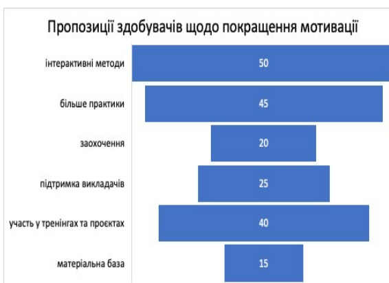
Рис. 3. Пропозиції здобувачів щодо покращення мотивації

Останнім блоком анкети було питання «Що, на Вашу думку, могло б підвищити Вашу мотивацію до навчання? (оберіть до 3 варіантів)». Результати представлено на рисунку 3.