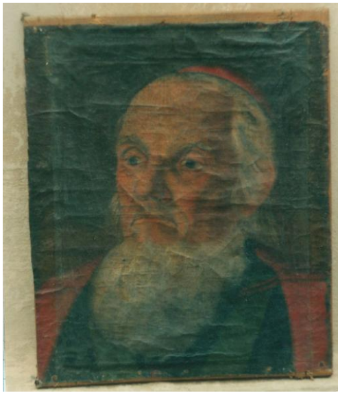
Рис. 1. «Портрет невідомого єпископа». Автор: невідомий художник. Вигляд до реставрації