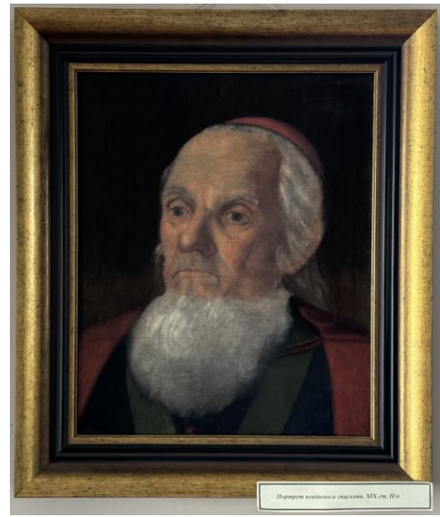
Рис. 1. «Портрет невідомого єпископа». Автор: невідомий художник. Вигляд до реставрації