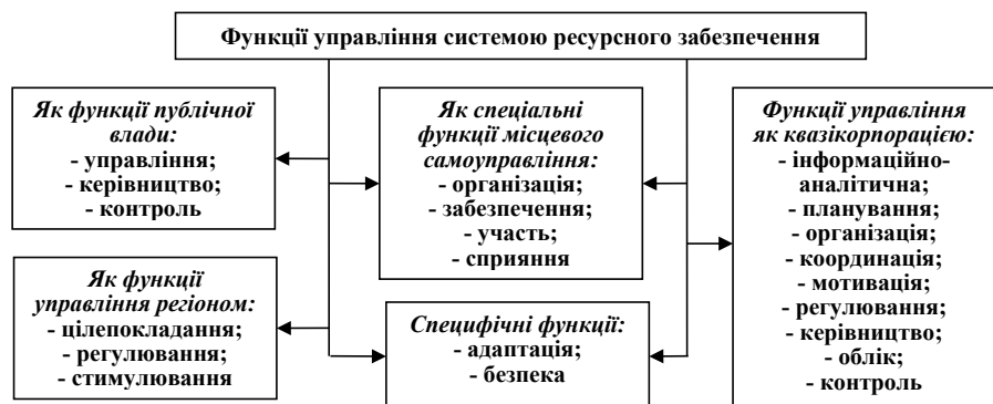
Рис. 2. Комплекс функцій управління системою ресурсного забезпечення економічної безпеки регіону

Центральною функцією органів регіонального управління є забезпечення економічної безпеки та стійкого розвитку регіональної системи, яка стає особливо актуальною під час кризи, постійних структурних змін, погіршення стану навколишнього середовища. Особливості управління системою ресурсного забезпечення, його