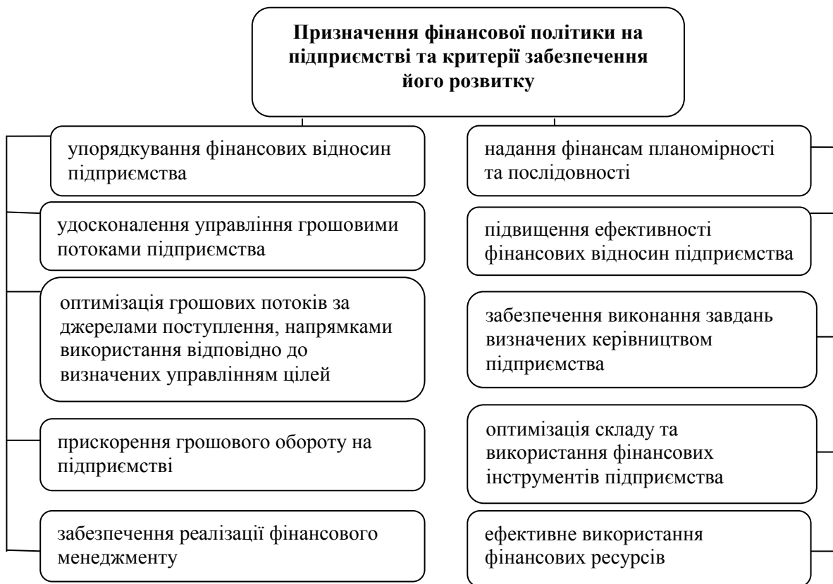
Рис. 2. Призначення фінансової політики на підприємстві та визначені критерії забезпечення його розвитку

Мета фінансової політики нерозривно пов'язана із стратегією розвитку підприємства і реалізується з нею в єдиному комплексі. У фінансовому менеджменті найчастіше виділяють сім основних моделей головної цільової функції підприємства і його підсистем, що управляють [7]: