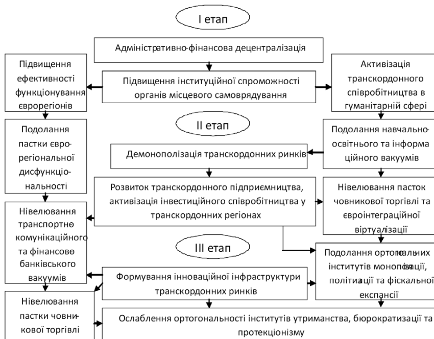
Рис. 2. Алгоритм ліквідації інституційно-правових бар'єрів у транскордонних регіонах між Україною та ЄС

- деградації соціального простору регіону через «розмивання» середовища формування середнього класу, порушення структурних співвідношень між «включенням» і «виключенням» різних груп населення з соціальних та економічних процесів, між ринком та державою, між збагаченням та маргіналізацією (обіднінням) населення, між суспільством і особистістю, між розвитком економіки та станом навколишнього середовища, між збереженням національної само-