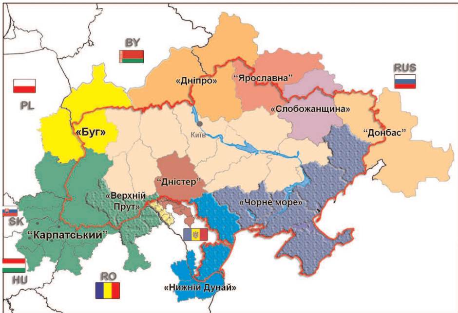
Рис. 1. Єврорегіони за участю України, авторська розробка

єврорегіональними структурами. Схематично єврорегіони України представлено на рис. 1.