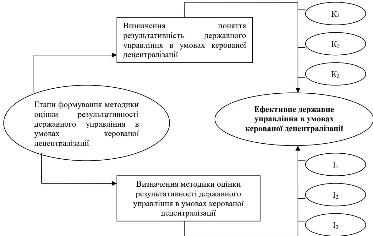
Рис. 1. Етапи формування методики оцінки результативності державного управління в умовах керованої децентралізації (складено авторами)

Показники (індикатори) оцінювання результативності проведених реформ повинні охоплювати всі сфери соціально-економічного розвитку регіону і оцінювати їх з позиції впливу на кризові процеси. Вони також повинні визначатися з урахуванням усієї сукупності функціональних і структурних ознак кризи, особливостей та рівня розвитку економіки, типу державного управління, специфіки часу, що дає змогу здійснювати регулярний всебічний і коректний моніторинг їх значень.