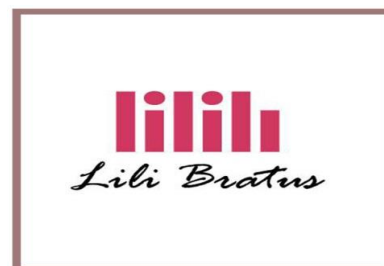
Рис.9. Бренд Лілії Братусь

Основною метою роботи Ательє Lili Bratus є створення унікального пізнаваного стилю для кожного, хто звертається до нас. Стиль, притаманний тільки Тобі. Стиль, що транслює Твій внутрішній світ назовні. Одяг, в якому ти належиш собі і знаєш хто ти. Це — справжнє чаклунство, що предсталено в колекції на (рис 10).