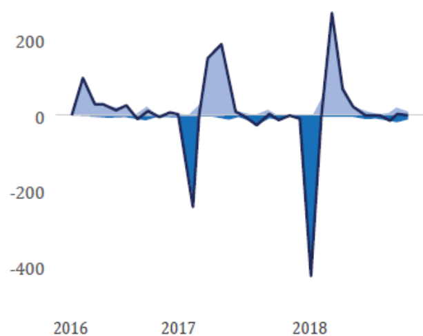
Рис. 2. Динаміка розміщення та відтоку депозитних вкладів бюджетів сіл у 2016-2018 рр., млн.грн [1]

Рисунки 1 та 2 відповідно демонструють динаміку залишків депозитних вкладів бюджетів сіл та їх розміщення у 2016-2018 рр. Залишки коштів на депозитних рахунках сіл різко зросли в 2017 році порівняно з 2016 роком. Утім, у 2018 році спостерігається незначне зменшення вкладень. На відміну від решти проаналізованих бюджетів ОМС, для бюджетів сіл характерне максимальне нарощення депозитів не в січні, а в лютому березні.