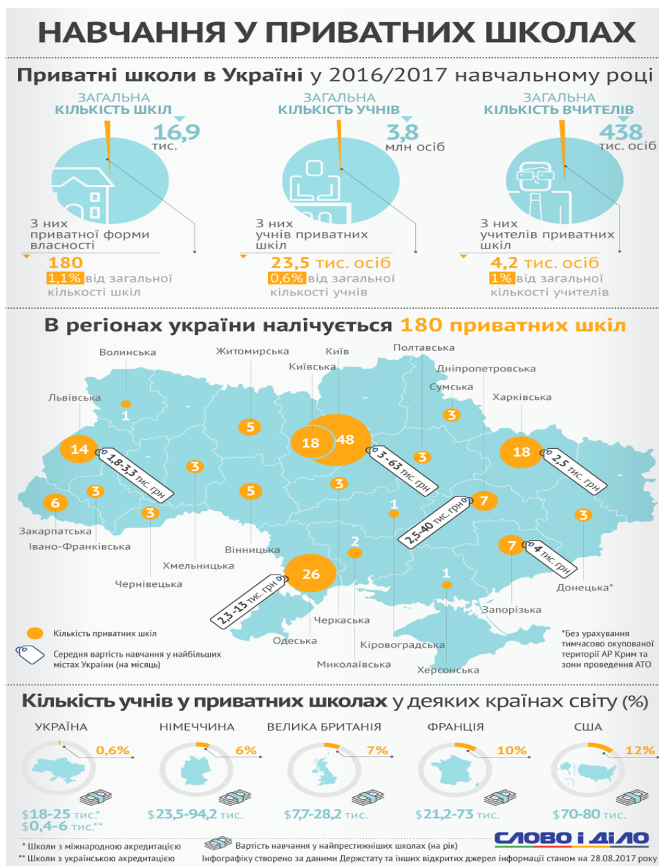
Рис 1. Навчання у приватних українських школах

приватній школі: загалом таких учнів близько 23,5 тисячі на всю країну, що становить лише 0,6% від загального числа школярів. [1, с. 2] Вчителі приватних шкіл охоплюють більшу кількість учнів, ніж державні освітні заклади (див. рис. 1). На одного вчителя приблизно припадає 5-6 учнів, тоді як у звичайних середніх школах учитель займається з 8-9 учнями. [2, с. 4]