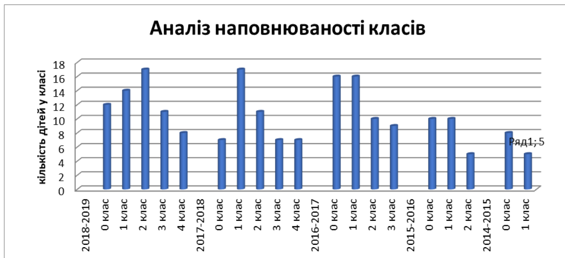
Рис 2. Аналіз наповнюваності класів приватного НВК «Еммануїл» за 2014-2018 роки

Як бачимо з рисунку 2, у 2017 році наповнюваність класів зменшилася приблизно удвічі у зв'язку з підняттям мінімальної заробітної плати в Україні з 3200 до 3723 гривень. Через нестачу додаткового фінансування організації довелося збільшити вартість навчання, і як бачимо, динаміка росту наповнюваності класів зменшилась, тому в наступному році було прийнято рішення шукати додаткові джерела коштів, щоб не збільшувати фінансове навантаження батьків. Колектив НВК прийняв рішення дотримуватись фіксованої оплати для отримувачів послуг (тобто батьків), адже стабільність - це запорука успіху.