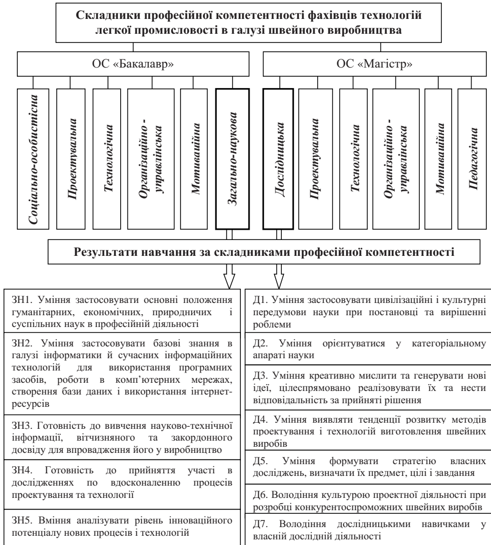
Рис. 1. Характеристика складників професійної компетентності фахівців технологій легкої промисловості в галузі швейного виробництва МДУ

Науково-дослідна діяльність студентів у ВНЗ насамперед реалізується в межах навчальних курсів, які дають змогу оволодіти основними навичками проведення наукових досліджень, сприяють підвищенню творчої активності студентів, розширенню їх знань з теорії, методики та технології наукових досліджень, розвитку умінь і навичок ведення експериментальних досліджень.