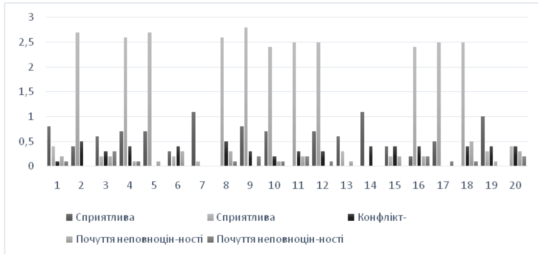
Рис.1. Зведені показники методики «Кінетичний малюнок сім'ї»

За результатами методики «Кінетичного малюнка сім'ї» ми розділили випробування сім'ї на 3 групи за отриманими даними, для того, щоб краще уявити загальну картину всіх результатів.