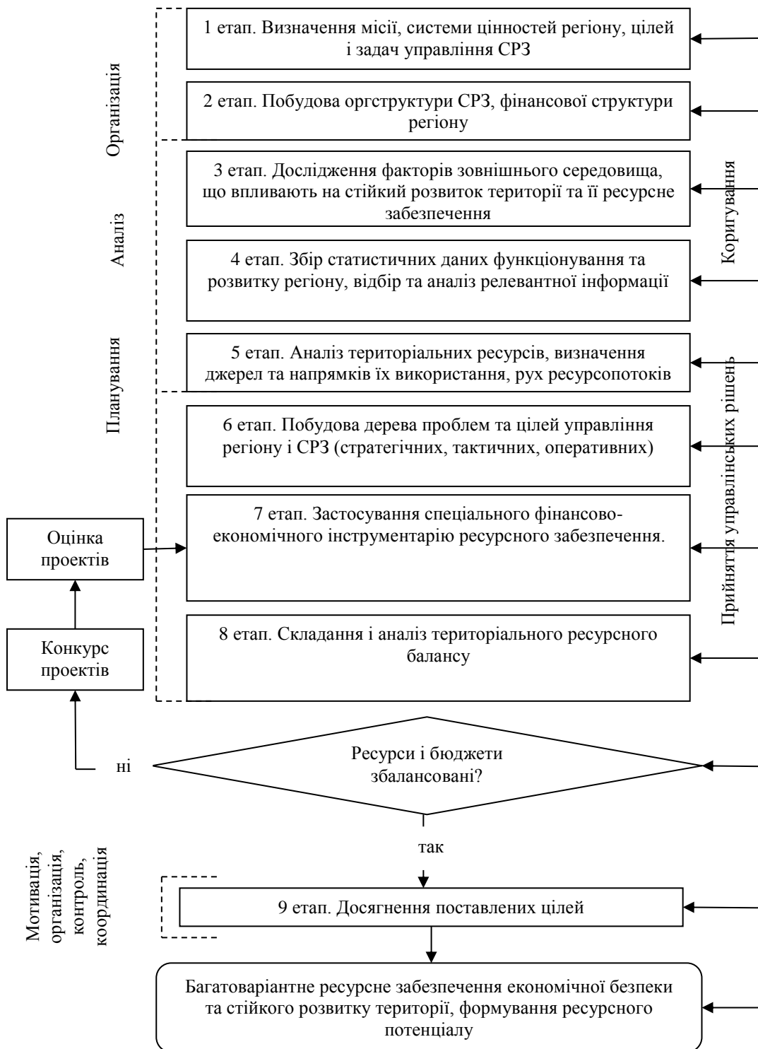
Рис. 2. Методика управління системою ресурсного забезпечення економічної безпеки та стійкого розвитку регіону.

регіонального управління загалом та системи ресурсного забезпечення зокрема. Визначення внутрішніх і зовнішніх груп стратегічного впливу та їхніх інтересів. Розробка соціальної, екологічної, економічної, інвестиційної та структурної стратегій. Правове забезпечення і громадська підтримка стратегії економічної безпеки та стійкого розвитку території;