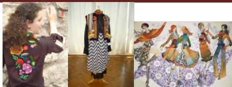
Рисунок 4: Творчі роботи студентів МДУ

Організація і проведення всеукраїнських та міжнародних творчих конкурсів в МДУ є показником його відкритості і прагнення до співпраці з іншими ВНЗ, впевненості у власній конкурентній здатності на ринку національної освіти. Важливою є також неформальна, але зацікавлена взаємодія викладачів, яка стає базою для обміну досвідом, авторськими педагогічними методиками і творчими ідеями. Зустрічі студентів і педагогів з різних ВНЗ на великих конкурсних заходах сприяють подоланню культурної та інформаційної ізоляції віддалених від центра дизайнерських шкіл та регіональної розмежованості. Конкурси наглядно демонструють потенціал конкретних дизайнерських шкіл: їх якісний рівень, художньо-стилістичні переваги, професійну специфіку.