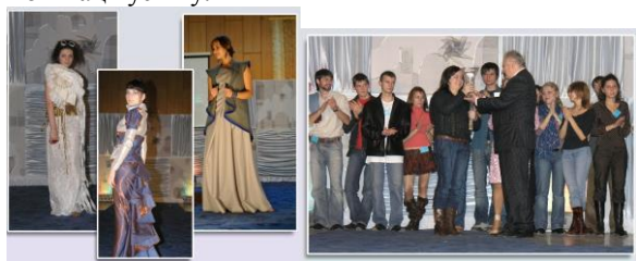
Рисунок 2: Конкурсанти-переможці конкурсу «Новий колорит»

Колекції одягу та одиночні ансамблі оцінюються за такими показниками: новизна та оригінальність ідеї, відповідність темі, стильове вирішення, рівень майстерності. Конкурс оцінює представниче журі, до складу якого входять мистецтвознавці, провідні фахівці в галузі моди, викладачі навчальних закладів – учасників конкурсу. Конкурсанти-переможці нагороджуються преміями, цінними призами та пам'ятними подарунками, запрошеннями на національні та зарубіжні конкурси. Найкраща творча робота серед лауреатів перших премій отримує Гран-прі. Загальна концепція організації та проведення конкурсу сприяє можливості саморозвитку студентів, підвищує рівень їх компетентностей та мотивації успіху.