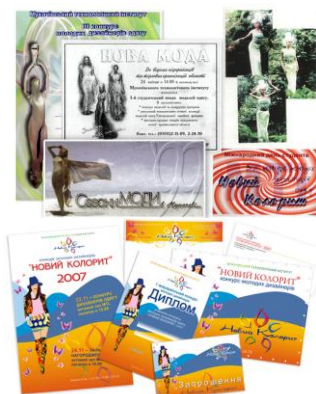
Рисунок 1: Рекламні пакети конкурсів в МДУ різних років

Участь студентів технологічного профілю підготовки в творчих конкурсах та конкурсах молодих дизайнерів являється важливою умовою підвищення якості освітніх послуг вищого навчального закладу, свідченням його готовності до подальшого вдосконалення. Тому конкурсам молодих дизайнерів завжди надавалось вагоме значення в контексті високопрофесійної підготовки майбутніх кадрів для потреб легкої промисловості. Починаючи з 1998р., на той час Мукачівський технологічний інститут започаткував студентські конкурси дизайнерів одягу «Нова мода», у 1999р. - «Сезони моди в Мукачеві» і, починаючи з 2003р. - «Новий колорит».