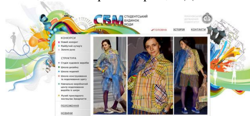
Рисунок 3: Сторінка офіційного сайту СБМ МДУ

Пріоритетним напрямком роботи СБМ є розвиток мистецької культури через індивідуальний стиль носія та проектувальника костюму: організація виставок, проведення конкурсів, науково-практичних конференцій, майстер-класів тощо. Співпраця СБМ з підприємствами регіону – один з напрямків прикладного спрямування розробок для потреб легкої промисловості. Окрім цього, СБМ безпосередньо сприяє формуванню позитивного іміджу інженерних спеціальностей факультету та університету в цілому серед школярів регіону. Для загального висвітлення роботи СБМ сформовано та постійно оновлюється офіційний сайт «Студентський будинок моди» на інтернет-сторінці МДУ.