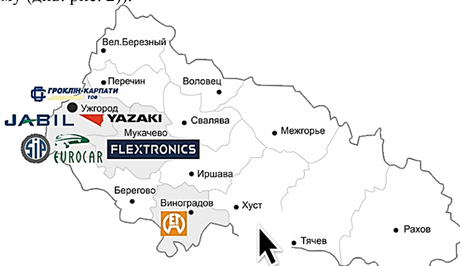
Рис. 1. Підприємницька онлайн-карта Закарпаття в структурі української сторони Карпатського Єврорегіону

В той же час інформаційний транскордонний бізнес-центр займатиметься, як наданням різноманітних онлайн-послуг місцевим та районним підприємцям (консультації в зовнішньоекономічній діяльності, міжнародному праву, в допомозі по отриманню сертифіката на продукцію європейського зразка), так і розширенням ринку збуту місцевих товарів і послуг в межах транскордонного регіону за рахунок ефективної презентації на веб-сторінці свого центру. В даній Інтернет сторінці вказуватимуться не тільки ті проекти, які реалізуються чи знаходяться на етапі обговорення, а й створення карти охоплення регіону (див. рис. 1), де було б видно, які галузі розвиваються, які підприємства в нас є, в які вигідно вкладати інвестиції (на основі того, що кожне підприємство повністю надавало б опис своєї діяльності та потенційні проекти зі строками окупності та економічними обґрунтуваннями, щодо економічної та соціальної віддачі в майбутньому (див. рис. 2)).