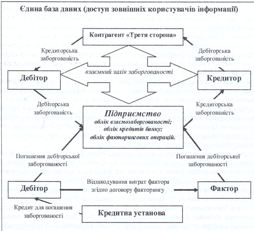
Рис. 2. Залучення зовнішніх користувачів інформації до обліку покриття дебіторської заборгованості з використанням єдиної бази даних

Цікавою є можливість залучення третіх осіб до процесів автоматизованого взаємного заліку заборгованості. Якщо існує ще один суб'єкт господарювання, який одночасно співпрацює з обома контрагентами, то доцільно перевірити стан його розрахунків та боргів. Досить часто буває ситуація, в якій підприємство має дебіторську та кредиторську заборгованість перед багатьма учасниками ринку, що дозволяє здійснювати почергове списання боргів. Автоматизована система здатна здійснювати поступове списання боргів одних підприємств перед іншими до моменту мінімізації загальної дебіторської та кредиторської заборгованості серед усіх господарюючих суб'єктів, які співпрацюють між собою. Обліковим фахівцям кожного з підприємств пропонуватиметься автоматизована схема взаємозаліку заборгованості, після отримання позитивної реакції усіх контрагентів на яку відбуватиметься автоматизоване формування облікових проведення. Схема обліку покриття дебіторської заборгованості завдяки залученню третіх осіб через єдину базу даних контрагентів подана на рис. 2.