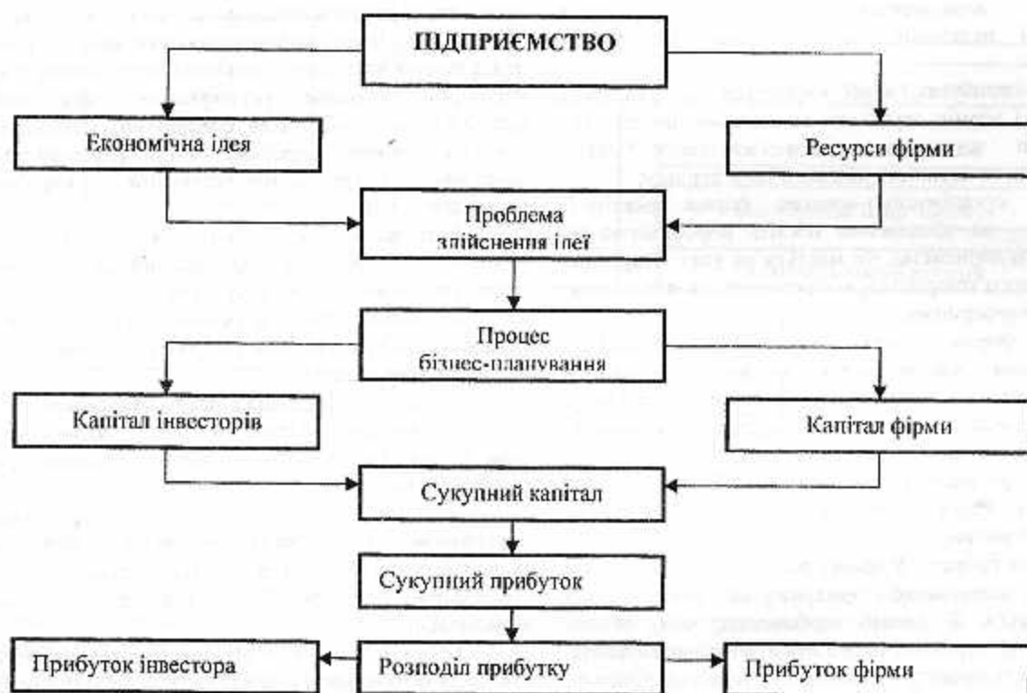
Рис. 2 Структурно-логічна схема процесу бізнес-планування [3]

Структурно-логічна схема процесу бізнес-планування зображена на рис.2. Вона пояснює місце бізнес-планування у житті будь-якого інвестиційного проєкту.