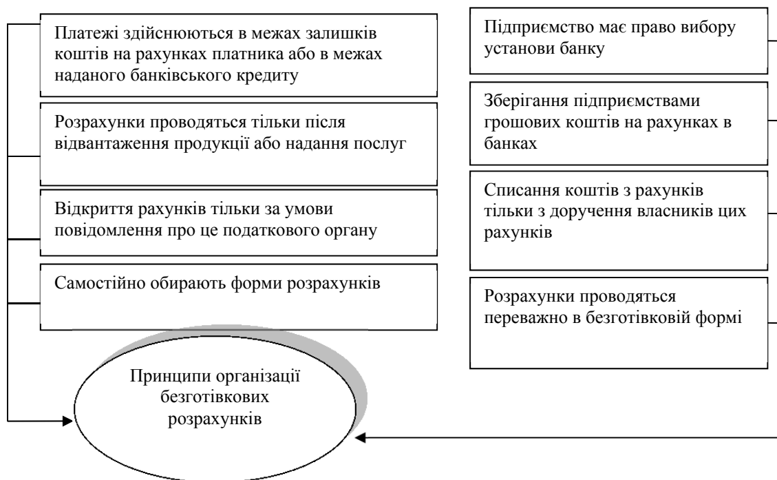
Рис. 1. Принципи організації безготівкових розрахунків

Принципи організації безготівкових розрахунків в цілому відбивають реальний стан національної економіки та визначають способи і форми розрахунків. Виділяють такі основні принципи організації безготівкових розрахунків які наведено на рис. 1: