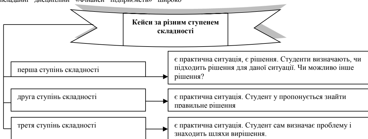
Рис.1 Кейси за різним ступенем складності

Перша частина вирішення ситуаційного завдання здійснюється студентами на протязі 2- ох академічних годин. Друга частина, яка пов'язана із заповненням фінансової звітності виконується самостійно на основі додаткового консультування. У процесі вивчення навчальної дисципліни в залежності від складності можна використовувати кейси різної складності: На рис. 1 наведено кейси за різним ступенем складності.