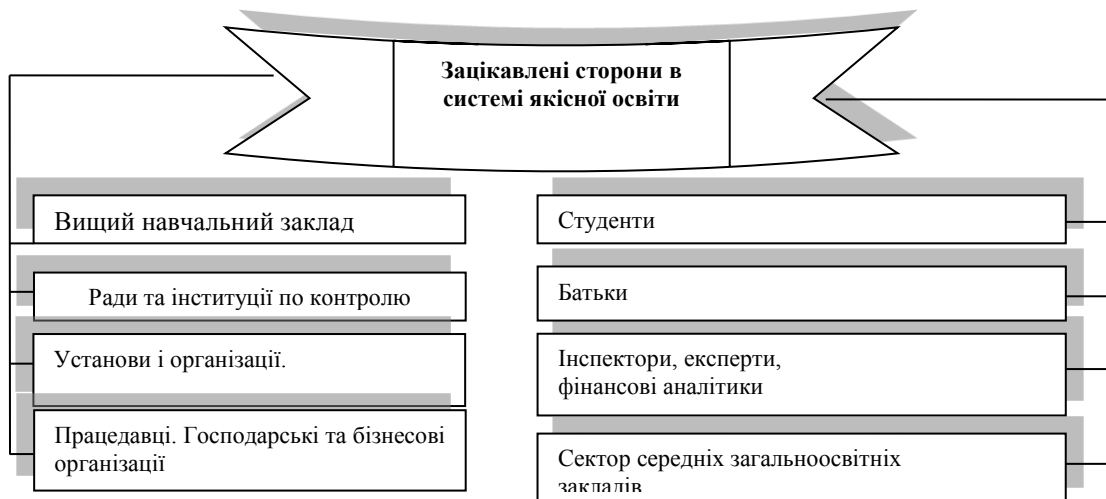
Рис. 2. Зацікавлені сторони в системі якісної освіти

З рис. 2 можна зробити висновок, що кожен із згаданих суб'єктів по-різному позначають поняття якості освіти, а тому іншим способом виявляють свої ознаки та властивості, які дають можливість реалізувати власну мету або мету освітнього закладу. Учасники процесу навчання, тобто держава, академічне середовище, ринок (студенти, роботодавці, випускники) вимагають від ВНЗ високої якості освіти, і вища школа має змогу