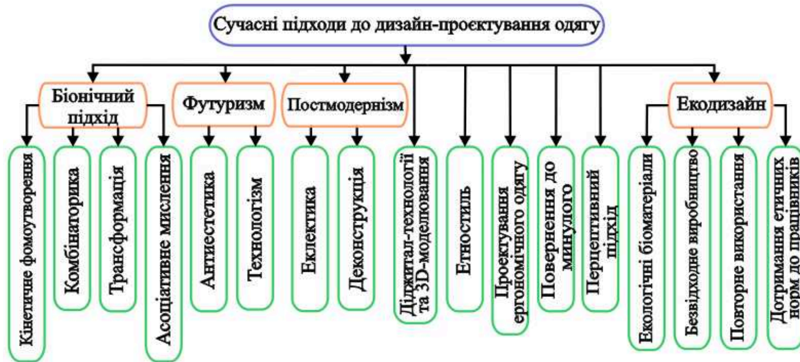
Рис. 1 Схема сучасних підходів до дизайн-проектування одягу