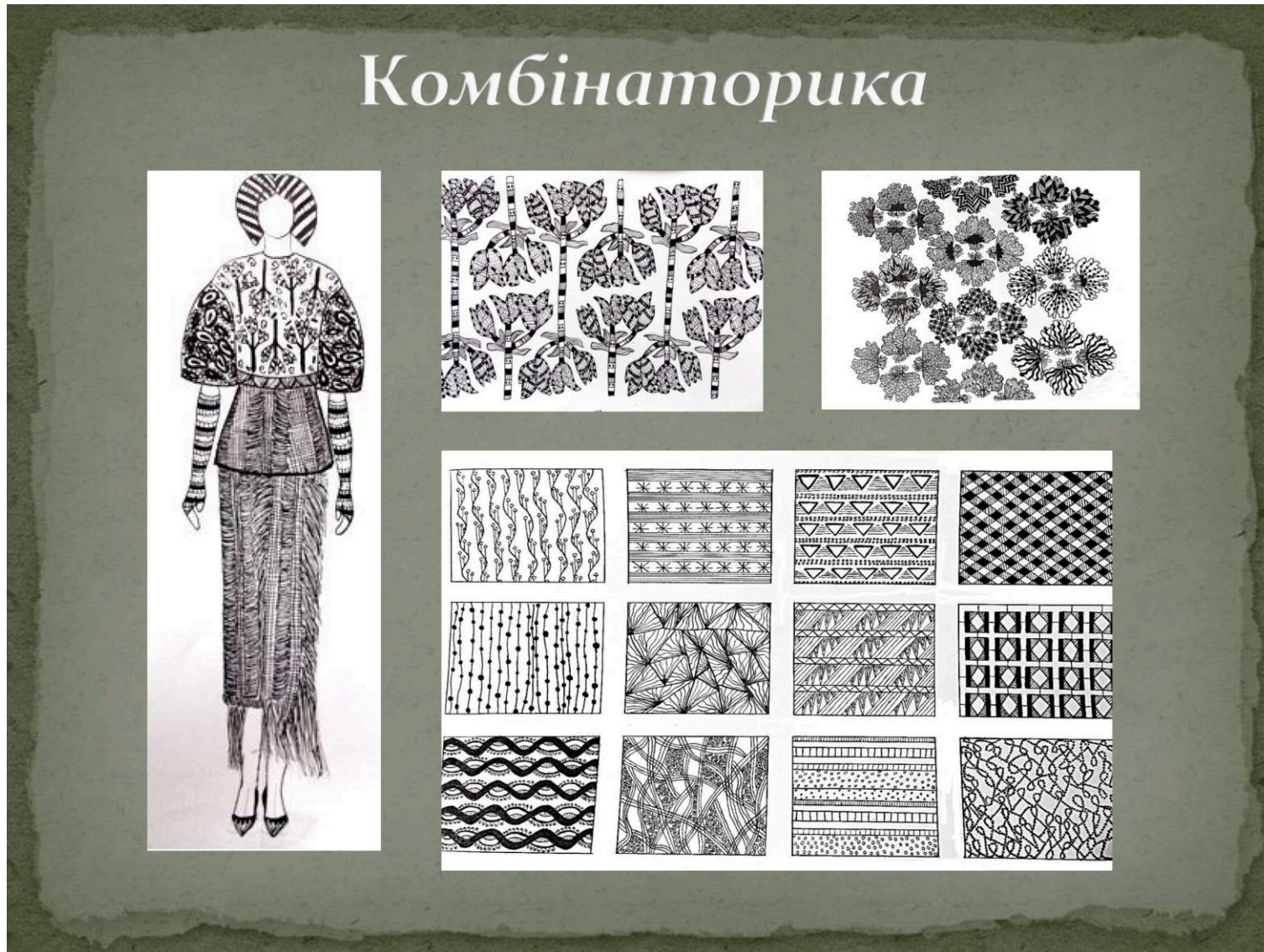
Рис. 4 Ілюстрація комбінаторного підходу до дизайн-проектування одягу та текстилю