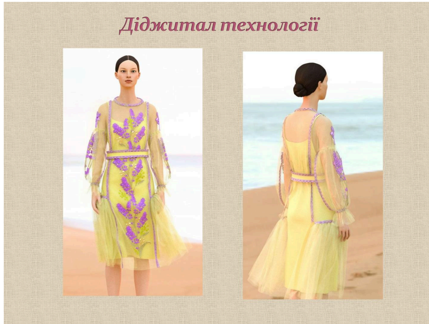
Рис. 6 Ілюстрація одягу, створеного завдяки використанню диджитал-технології