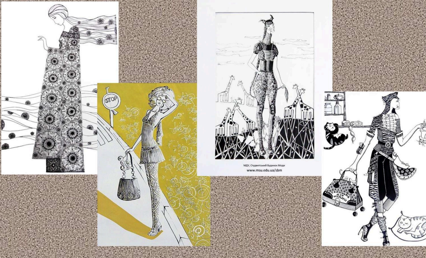
Рис. 2 Ілюстрація застосування біонічного підходу до дизайн-проектування одягу

Біонічний підхід - створення нових форм та конструкцій одягу на основі вивчення природних аналогів як найбільш доцільних форм та конструктивних рішень навколишнього предметного середовища, закономірностей їх побудови та умов функціонування