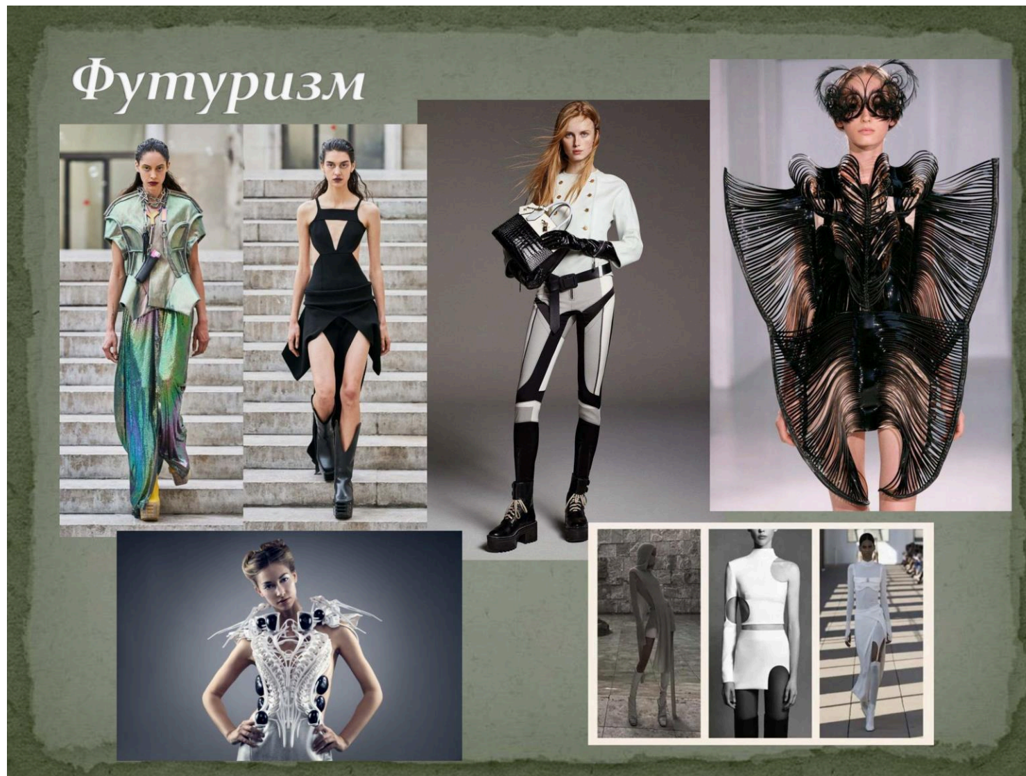
Рис. 9 Ілюстрація одягу, виконаного в стилі футуризму