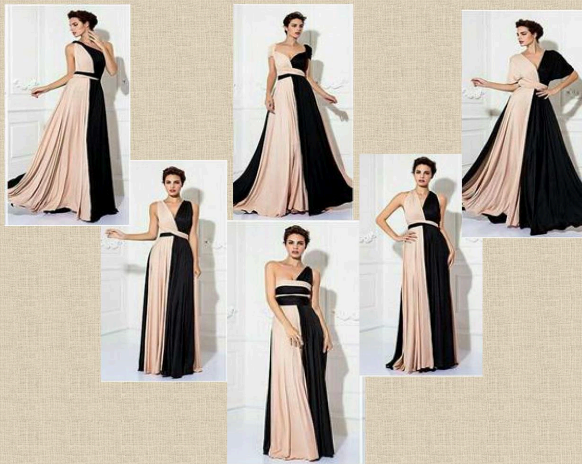
Рис. 3 Ілюстрація одягу, створеного методом трансформації