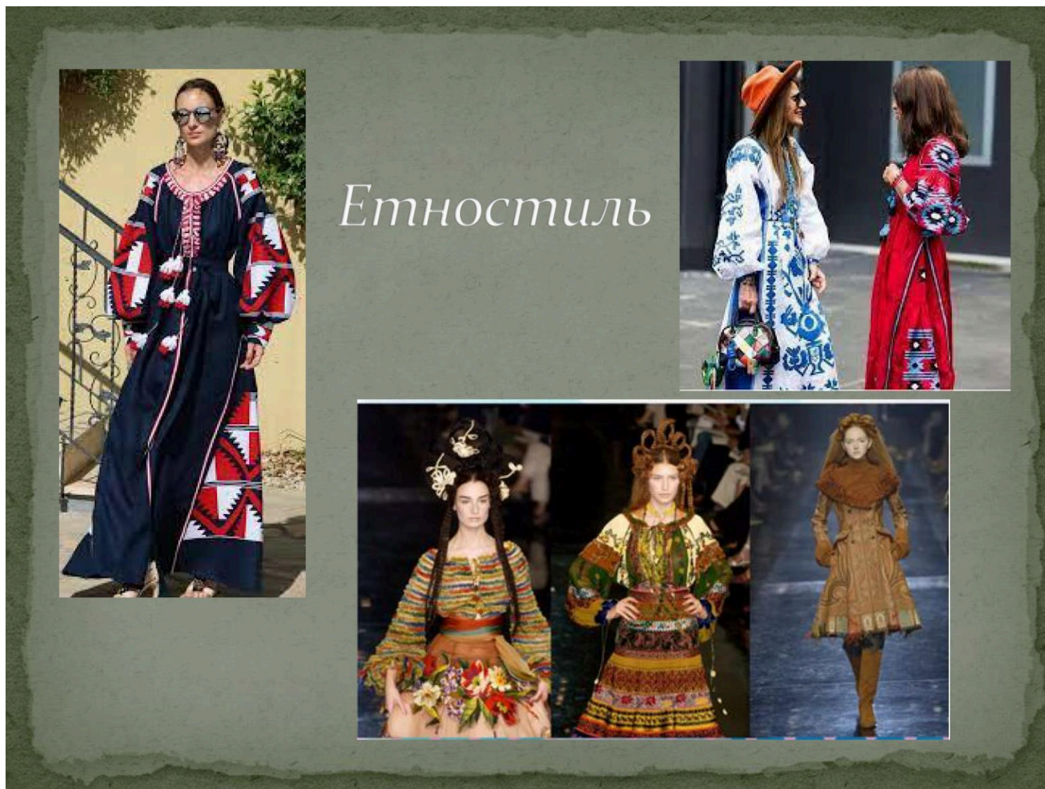
Рис. 8 Ілюстрація одягу, виконаного в стилі етно