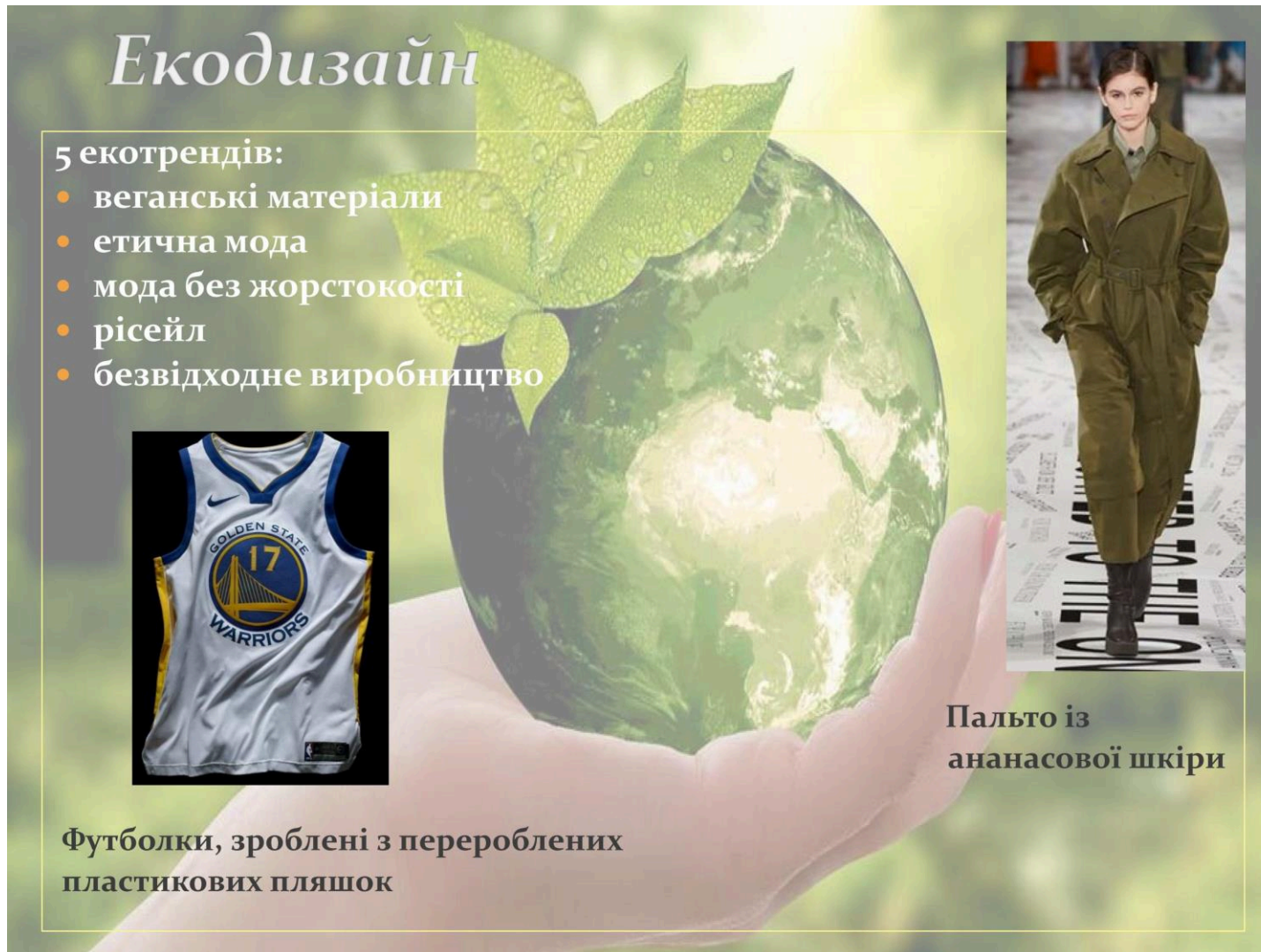
Рис. 7 Ілюстрація одягу, при виробництві якого застосовано екодизайну