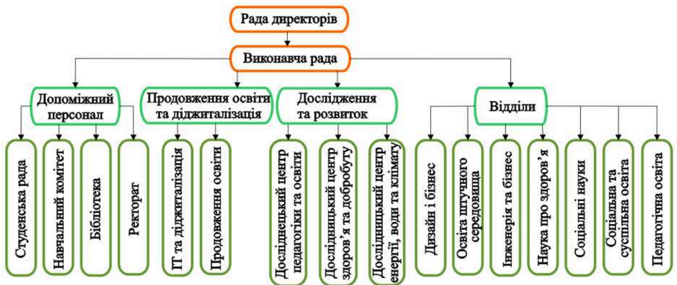
Рис. 10 Організаційна схема функціонування Університетський коледжу VIA

Зазначимо, що університетський коледж VIA є одним із шести університетських коледжів Данії, загально визнаним державним закладом вищої освіти, діяльність якого регулюється Міністерством вищої освіти та науки Данії. Освітні програми, курси підвищення кваліфікації та дослідження, що проводяться коледжем, зосереджені на питаннях підготовки фахівців у таких сферах, як охорона здоров'я, навчання, соціальна освіта, технології, бізнес і дизайн (Офіційний сайт VIA University College, 2023). Організаційна схема функціонування Університетського коледжу VIA представлена на рисунку 10.