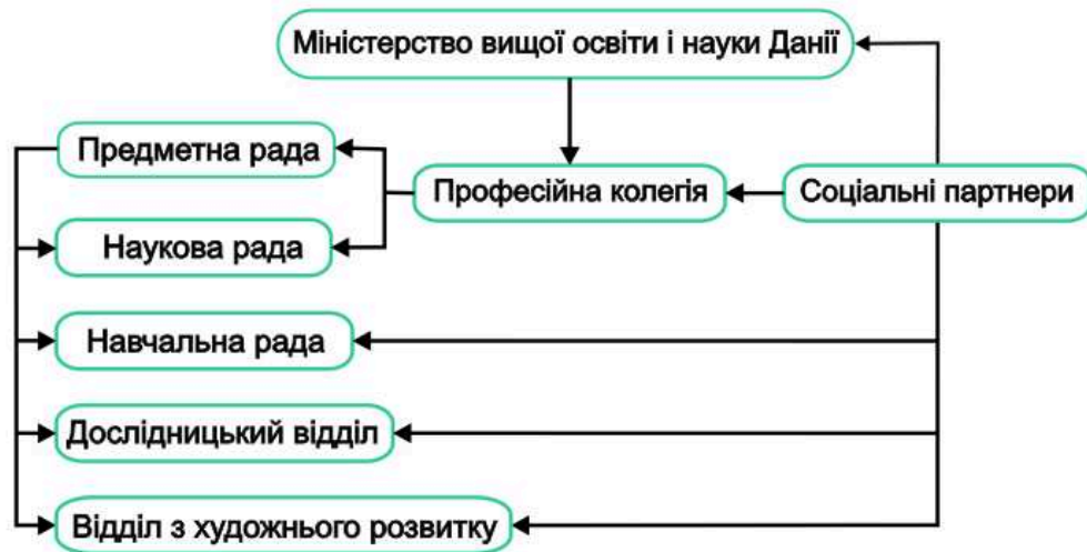
Рис. 9 Схема управління якістю освіти у вищому мистецькому освітньому закладі Данії