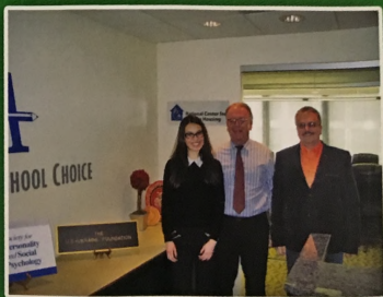
Зустріч українських науковців з віце-президентом US-Ukraine Foundation