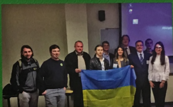
Презентація українською делегацією наукових проєктів Прикарпатського національного університету імені Василя Стефанива за результатами порівняльних досліджень гір Аппалач і Українських Карпат