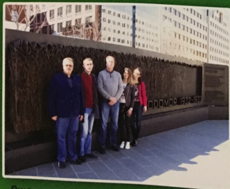
Вшанування пам'яті жертв голодомору в Україні 1932-1933 р.р. (м. Вашингтон, США)